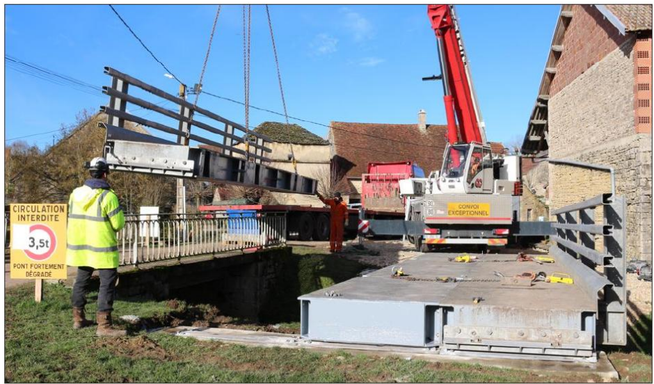
Un pont de 27 tonnes a été installé dans le petit village pour relier une partie des habitants au reste de la commune.